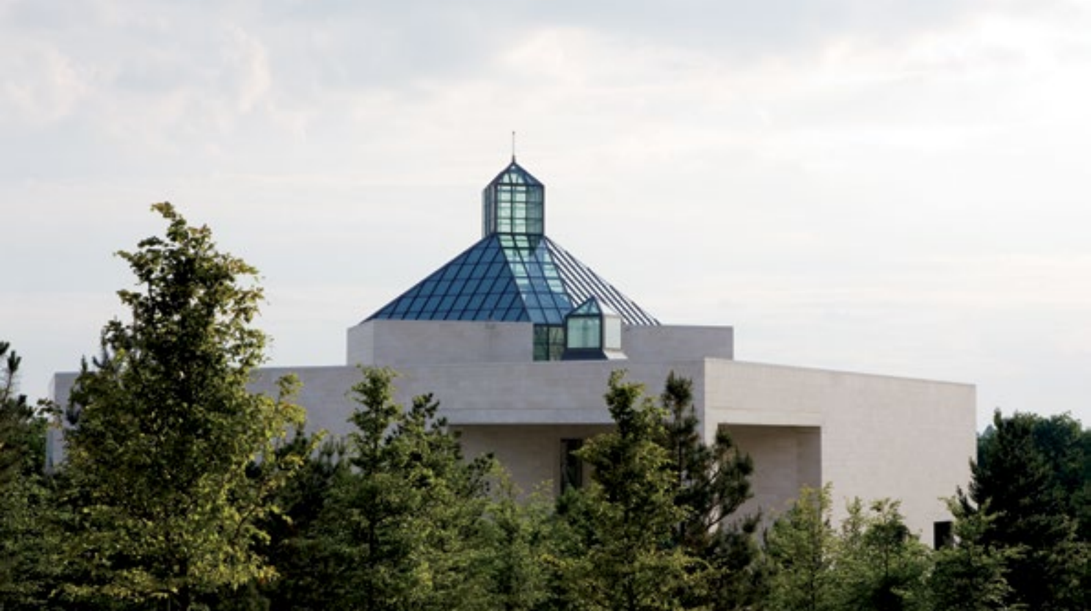
Mudam Luxembourg – Musée d’Art Moderne Grand-Duc Jean | Jeoh Ming Pei Architect Design